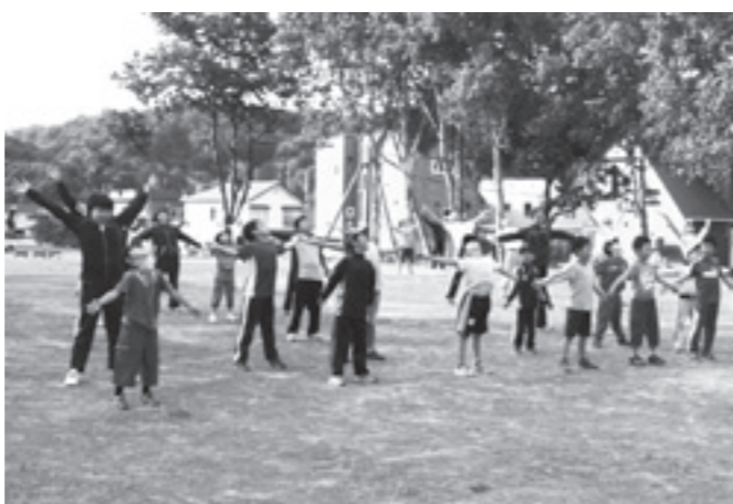
▲表彰を受けた『健康づくりラジオ体操』

り、子どもの基本的な生活習慣づくりの場、多世代の交流の場として、地域全体に定着した事業となっています。