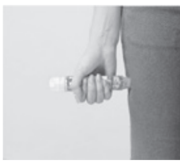
▲エピペン注射の使用方法

いったんアナフィラキシーになれば1分でも早く特效薬を打たなければ命に関わります。それでもそばに医療機関があるとは限りません。そんなとき命綱となるのが「エピペン」です。これは携帯できるアナフィラキシー対策の注射で、どこにいても服の上から自己注射することができ