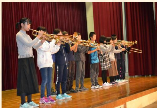
5年生 音楽「歌って、踊って、演奏しよう in 喜茂別」