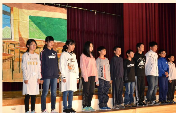
終わりの言葉を述べる6年生