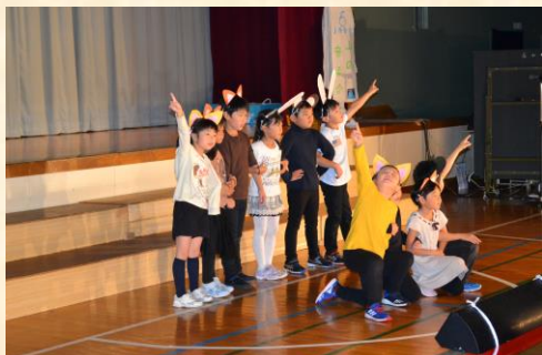
1年生 音楽「山の音楽会」