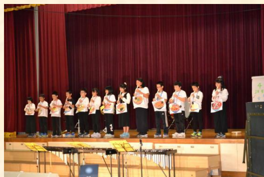
3年生 音楽「腹ペコぼくらの食いしん坊 ハンザイ!!」