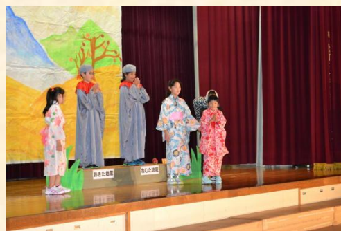
4年生 劇「ねむた地蔵 おきた地蔵」