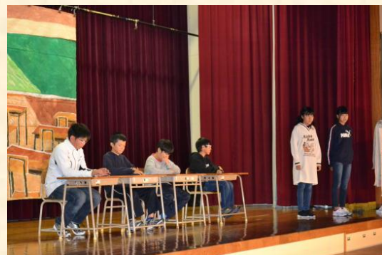
6年生 劇「ギャラクシートレイン」