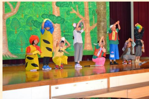
2年生 劇「ももたろう」120周年スペシャル